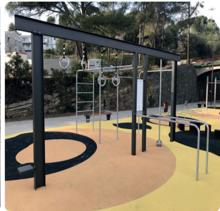
Crosstraining 1 in la Ciotat, France

- Israel - Italy - Latvia - Lithuania - Malta - Morocco - Norway - Romania - Russia - Scotland - Singapore - Slovakia - Spain - Sweden - Switzerland - Taiwan - The Netherlands - Ukraine