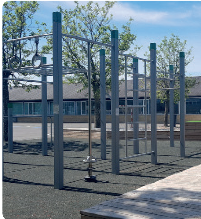
Streetworkout in Roslev, Denmark