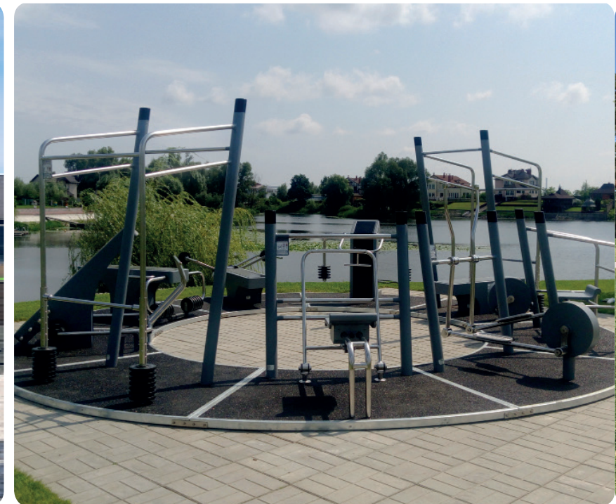
Sportpoint in Kiev, Ukraine