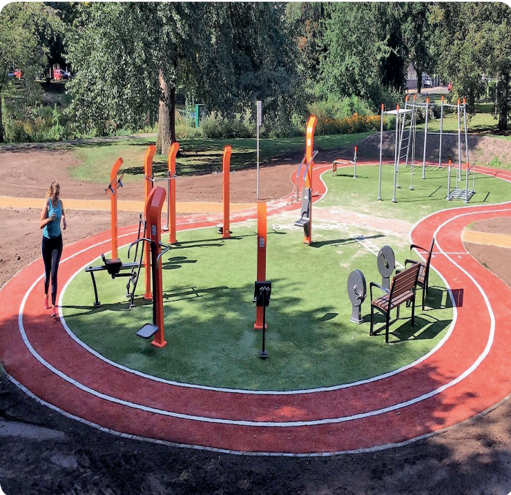
Gym + Basix in Groningen, The Netherlands