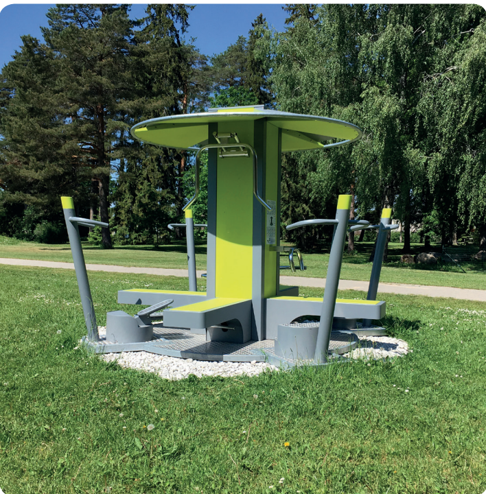
Fitpoint in Pisisaare, Estonia