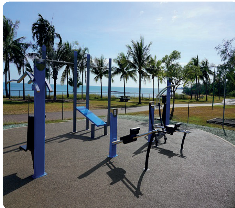
Gym + Streetworkout in Darwin, Australia