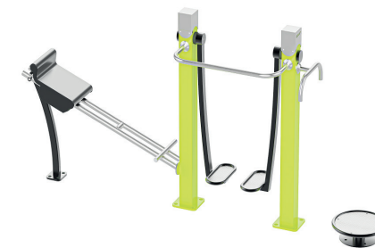
Gym Combi / Gym Inclusive products Gym Combi / accessible aux personnes à mobilité réduite